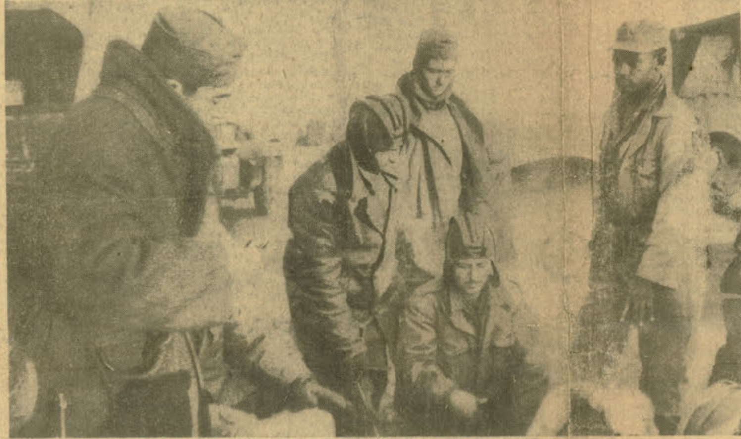
Muharabeden kurtulan ellerimizden, bir grup, P'yongyang'da hasret kaldıkları ateş başında (Yazısı 4 üncü sahifemizde)

(Kore harbi muhabirimiz Faruk Fenikten bu sabah aldığımız mektub)