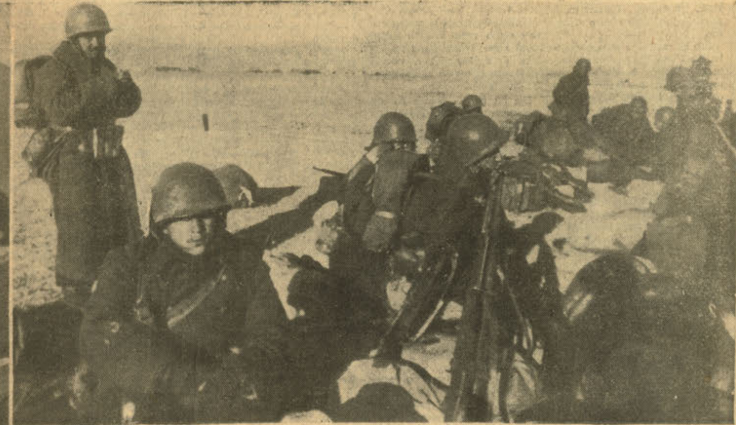
Büyük ve çetin savaşlardan sonra ilk mola...