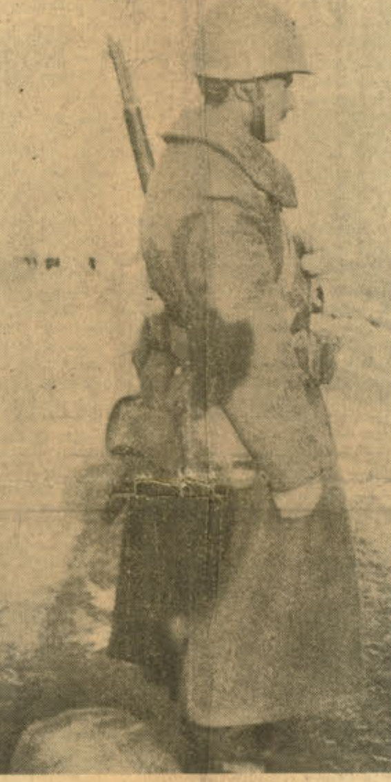
Yeniden savaşa hazırlanan bir erimiz