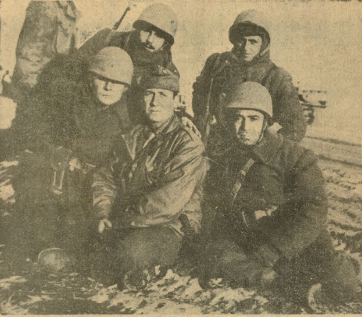
Çenberi parçalayan kahramanlarımızdan bir grup komutanlarla bir arada