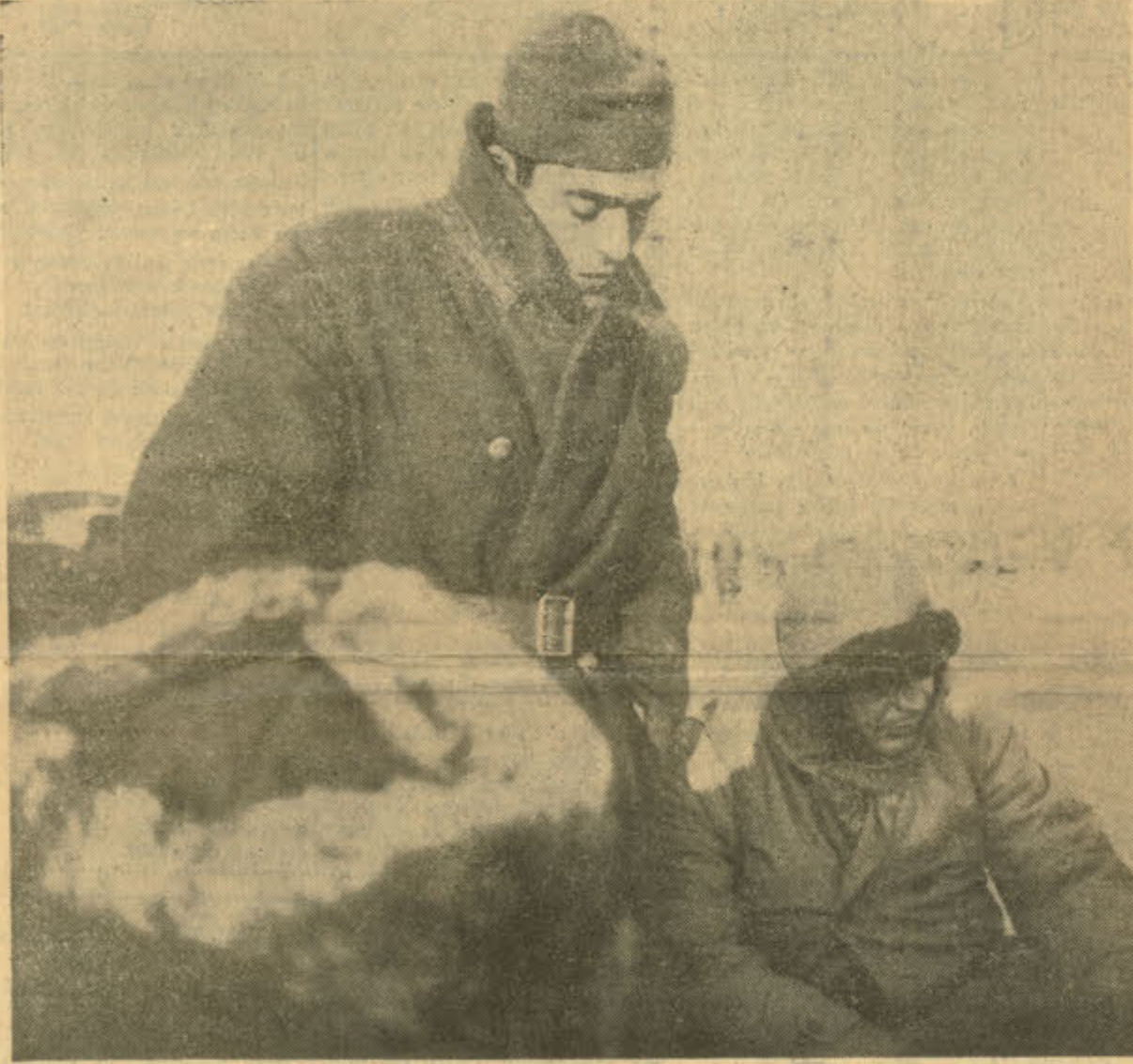
Çetin savaşlardan sonra bir dinlenme ânı