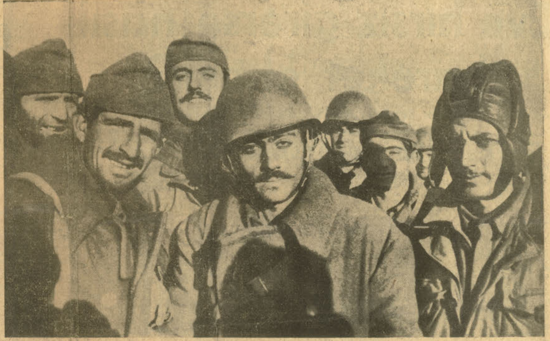
Çetin savaşlardan sonra Pyonyong'a varan ilk kafilé