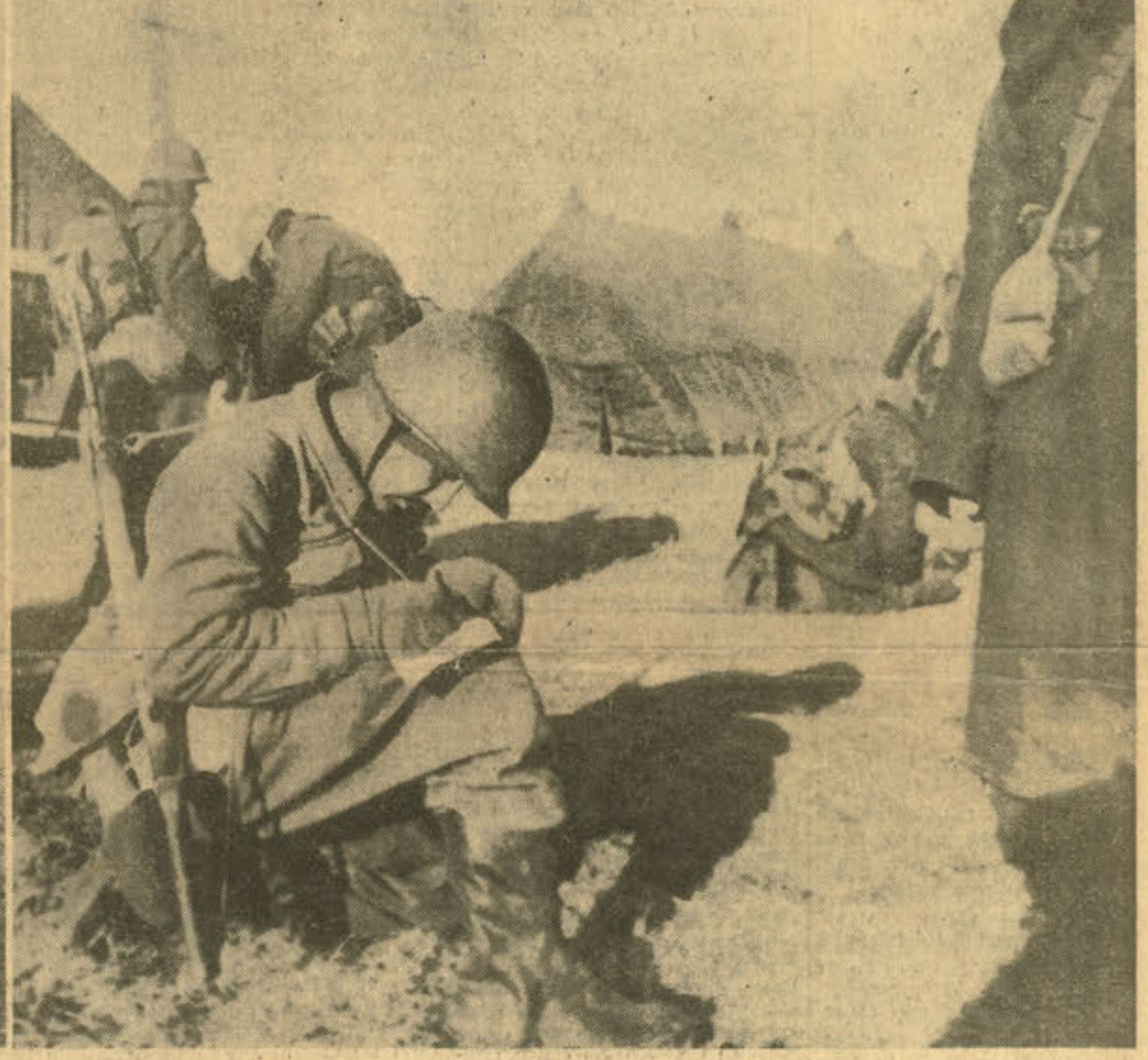
Savaşın sonra yurda ilk mektub