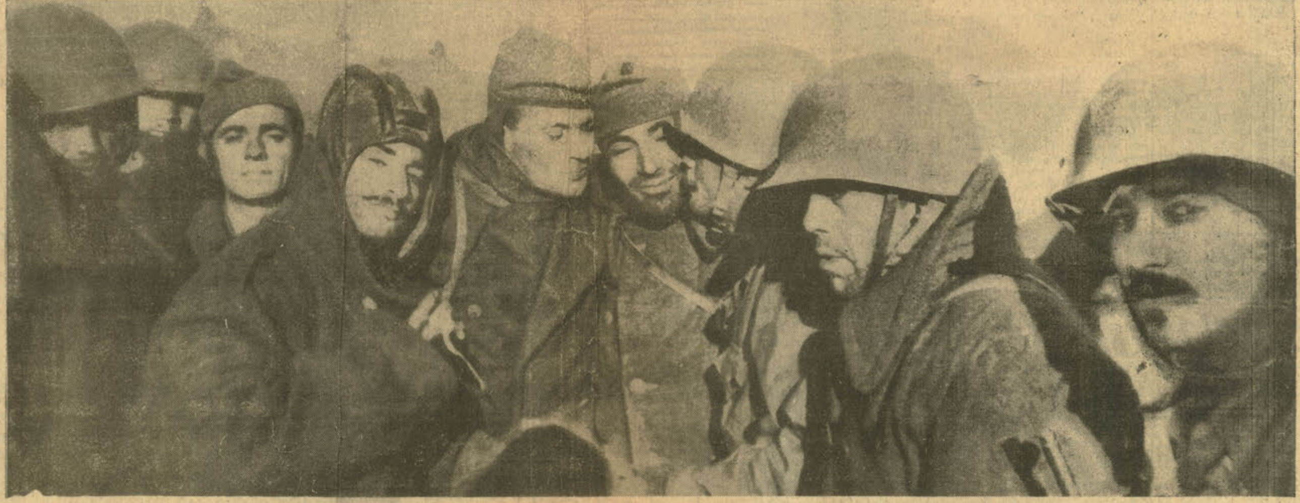
Sarılan ve düşman çenberini yaran kahramanlar, Birliğe kavuştukları ilk anlarda ordaki arkadaşlarıyla sarılıp öpüşürken «Cumhuriyet» objektifi karşısında

(Bu baskımızda gördüğünüz resimler Kore harbi muhabirimiz Faruk Fenik tarafından 1. 2. 3 Aralık günleri P'yongyang'da çekilmiş, oradan uçakla Tokyo'ya götürülmüş ve Tokyo'dan dün gece sabaha karşı çekirizimze gelen Paa uçağı ile buraya yollanmıştır. Bu suretle «Cumhuriyet» ile İstanbul arasına rekor denemesi sekide ilk uçuşu gence imiş oluyordur.)