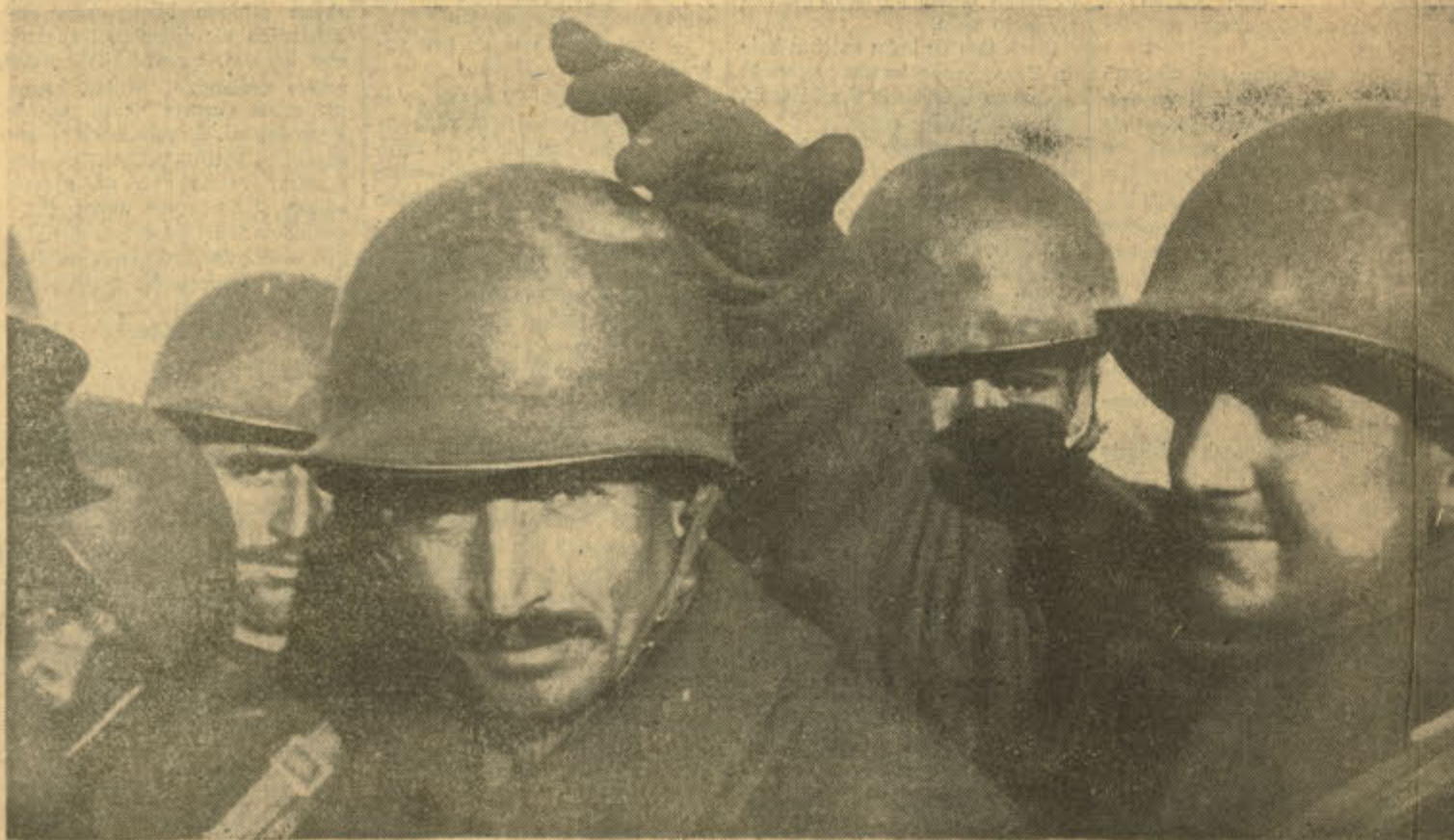
Mıgferine bir şarapnel parçası isabet eden bir erimiz