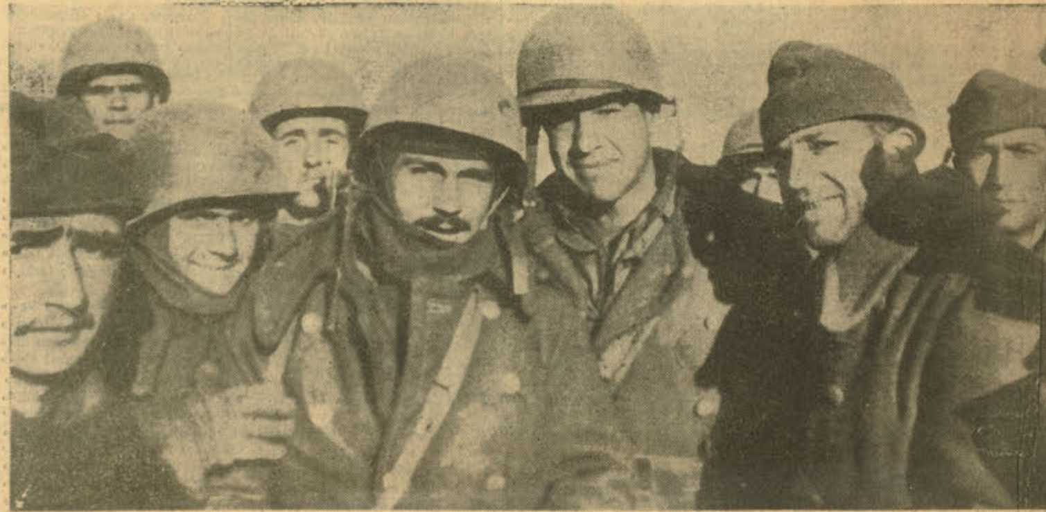
Mühtelif kıtalarda çarpışmaların savaşın sonra birleşmekten duydukları neşe