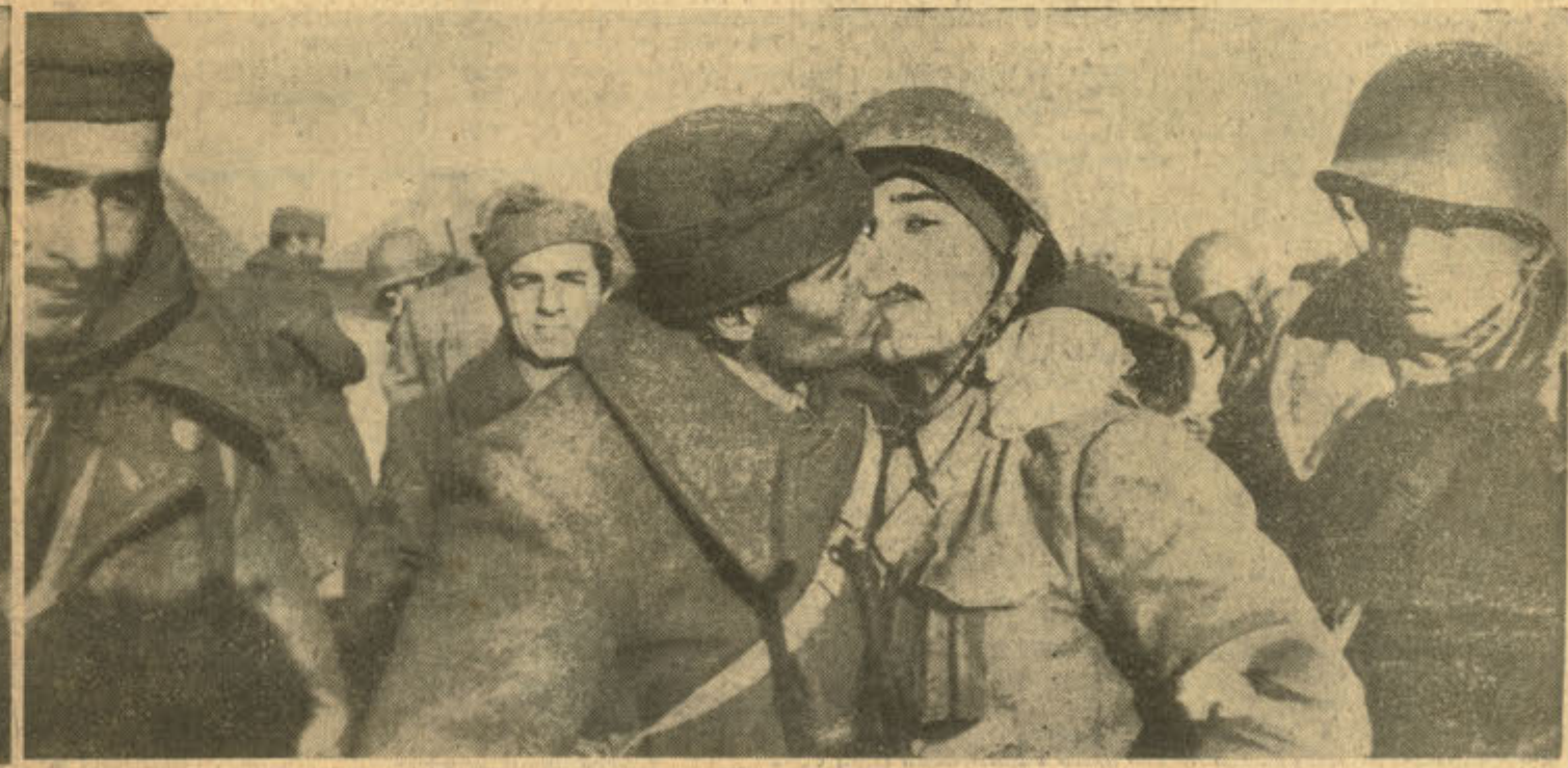
Bir sabıhye erimiz, ilk hatlarda düşmanla çarpışan arkadaşla kucaklaşırken