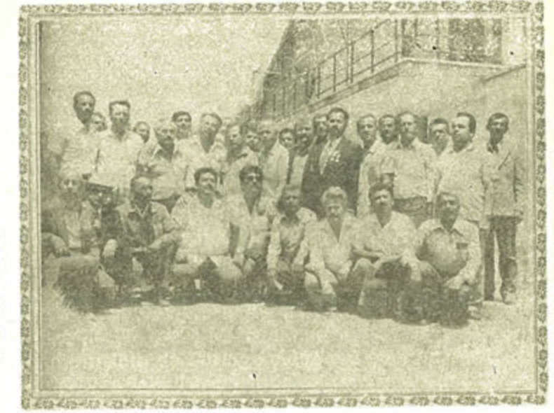
Karsavaş Hatay Şubesinin 12 Haziran 1977 Pazar günü yapılan kongresinde, toplantıdan sonra Dernek üyelerinden bir grup yeni Yönetim Kurulu Başkanı ve üyeleri, Genel Merkez örgüt başkanı ile birlikte Antakya Belediye Parkı kafelerya düğün salonu önünde

Seçilen Başkan ve Yönetim, Denetim, Onur Kurulu üyeleri Genel kurula tanıtılmak üzere Salonun ortasına da Davet edildi. Tek tek takdim edildi. Her Üye ve Başkan Çoşkun alkışlarla Kut-