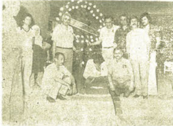
Cenaze töreninde, arkadaşları merhumu son yolculuğa uğurluyorlar.

Adres. : Eski Cami Mah. Helvacılar Sok. No. 17. SALİHLİ