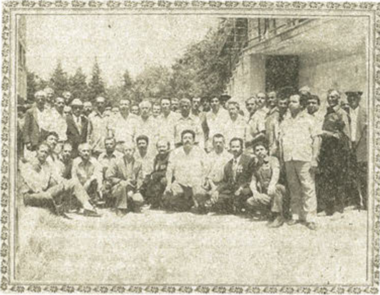
12 Haziran 1977 Pazar günü Korsavaş Hatay Şubesinin yapılan Genel Yönetim Kurulu toplantısından sonra Kongreye katılan gazilerden bir grup toplu halde

12 Haziran 1977 Pazar Günü Antakya KORSAVAŞ Şubesi Kuruluşundan bu yana ilk Genel Kurul toplantısını yapıyordu.