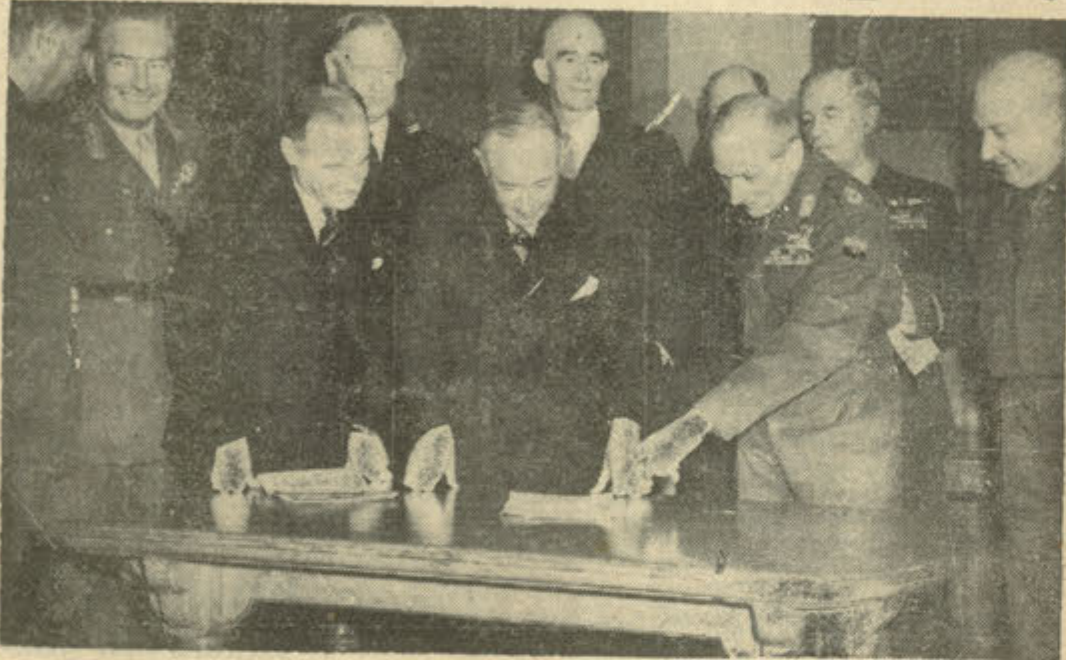
Mareşal Montgomery ve diğer askerî şefler, İngiliz savunma ve teriyeli birlikleri ile birlikte Avrupa'nın müstakbel müdafaası planı üzerinde görüşüyorlar.

Üç Müttefik yüksek komiseri bugün Adenauerle müzakereye başlayacaklar