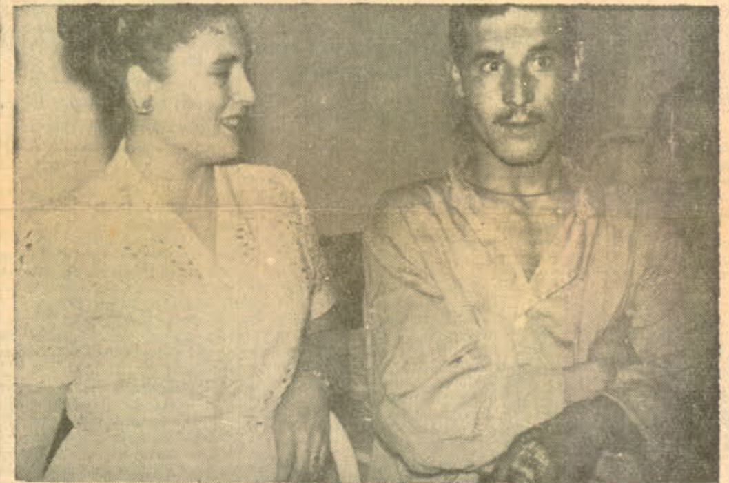
Tokyonun Anex hastanesindeki bir yaralı Mehmedimizi ziyaret eden Japonyalı Türklerden bir bayan.