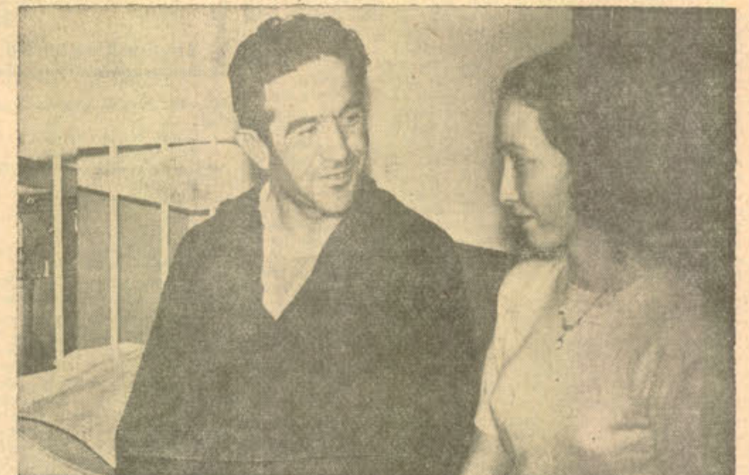
Yine aynı hastanede yaralı bir kahramanımızı ziyaret eden Tokyolu bir Türk bayan.