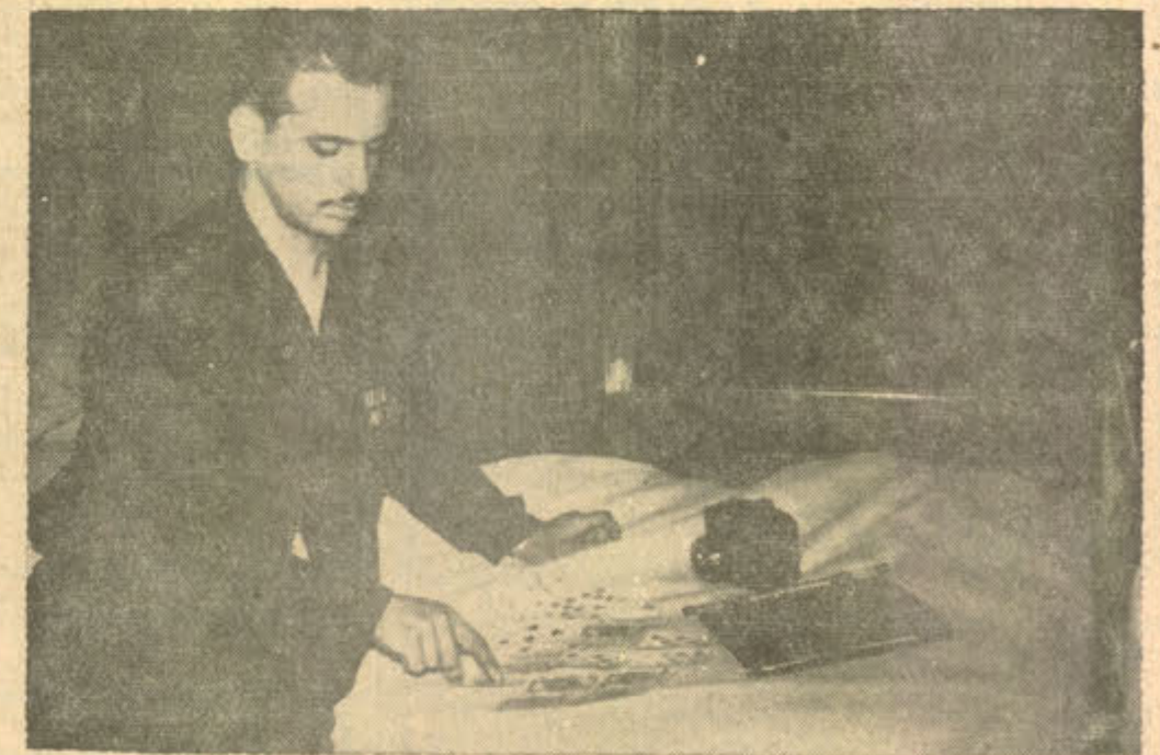
Hastanede yatağının üstünde is kambıl falı bakan bir yaralıımız.