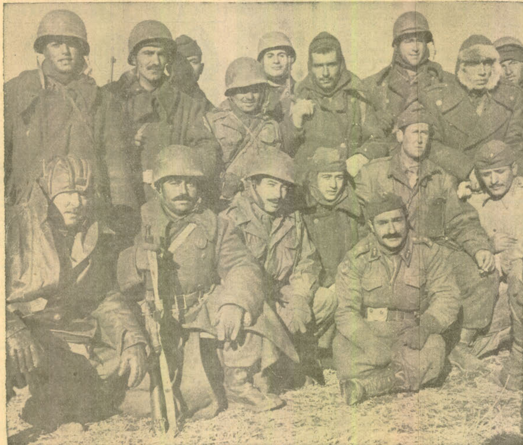
Kore savaş birliğimizden bir grup HÜRRIYET objektifi karşısında. (Bu resim muhasaradan kurtulduktanır kaç saat sonra alınmıştır.)