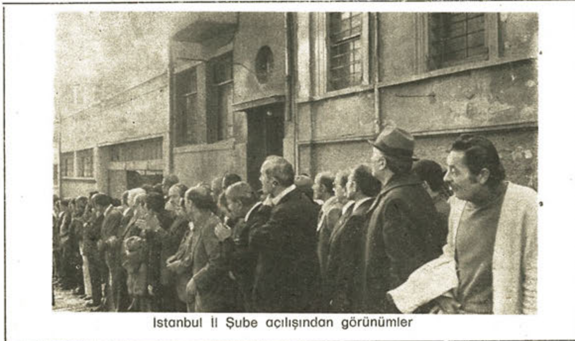
Istanbul İl Şube açılışından görünüm

Yerli telefon gereksinmesinde fazla devreye halâ ihtiyaç duyulmasına rağmen, açıklık giderek kapatılmakta ve telefon servisi direkt numara çevirme ve otomatik devre yenilikleriyle süratle geliştirilmektedir.