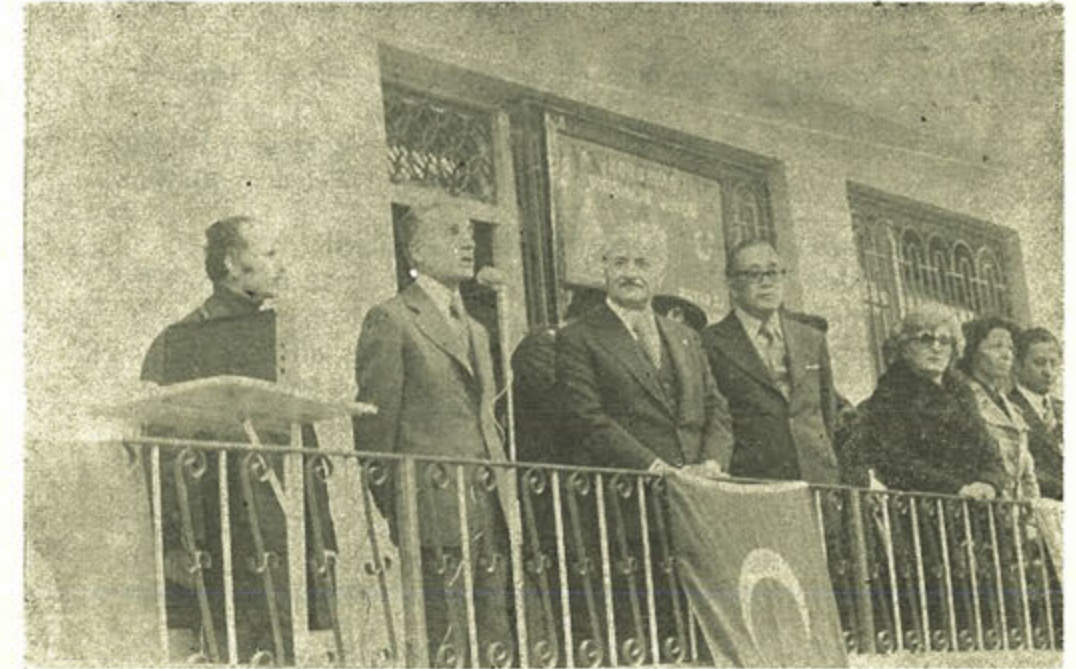
Hatay Şubesinin açılışından görünüm..