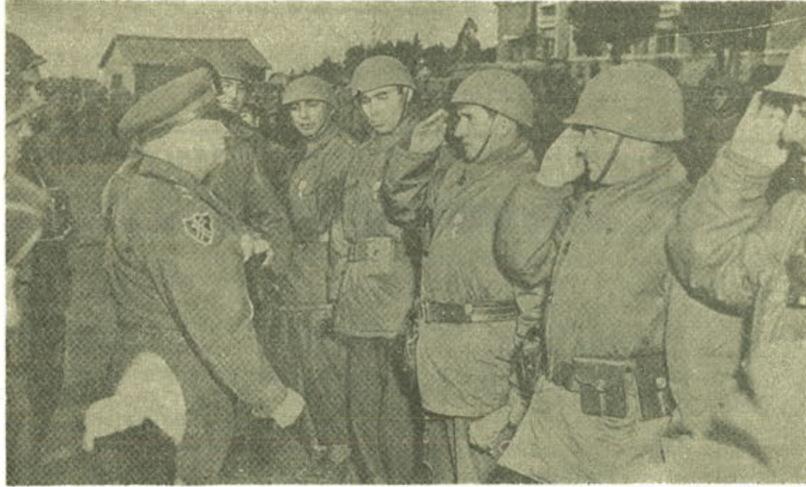
Kahramanlar önünde duyulan heyecan

Derlenen rakamlar, son beş yıl içindeki çeşitli Saemaul (Yeni Toplum) projelerinde 332.212.000 iş günü, bir başka deyişle yılda 66.442.000 işgünü harcanıldığını ortaya koymuştur.