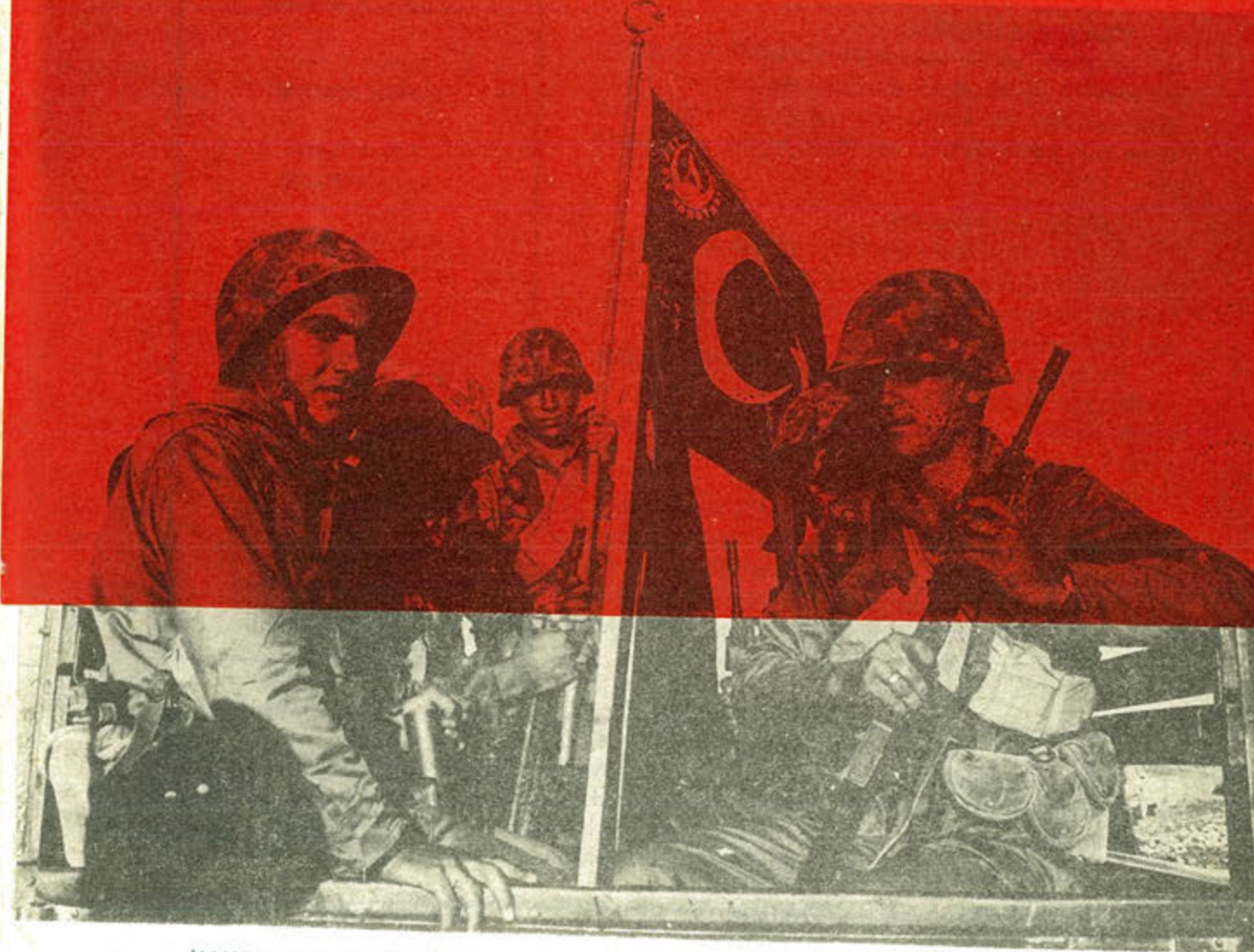
KAHRAMAN GAZİLERİMİZ ve KIBRIS MÜCAHİTLERİ BİRLİKTE GÖREV BAŞINDA